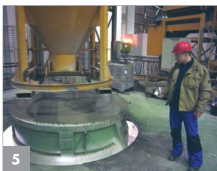
Kontrolle des Verdichtungsprozesses über Handfunk