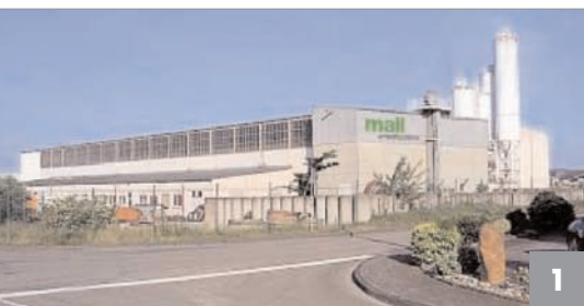
Der neue Produktionsstandort der Firma Mall in Nottuln

Die Firma Mall Umweltsysteme GmbH produziert Umweltsysteme zum Schutz von Wasser und Böden, z.B. Anlagen zur Regenwasserbewirtschaftung, Abwasserreinigung und Lagerung von Holzpellets. Um die Marktpotenziale in Nordwestdeutschland und den Benelux-Ländern besser ausschöpfen zu können, wurde in 2006 ein Betonwerk in Nottuln bei Münster als insgesamt fünfte Produktionsstätte von Mall übernommen (Abb. 1). Anschließend war der technische und marktgerechte Ausbau des neuen Werkes notwendig. Da Versuche mit SVB nicht die gewünschten Ergebnisse gebracht hatten und es u.a. zu Rissbildung in den fertigen Betonprodukten kam, stand fest, dass für die Verdichtung Hochfrequenz-Vibration eingesetzt werden muss.