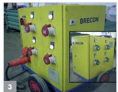
Mobile Steuerung für SL-Rüttler (rot) und konventionelle Rüttler (grün)

Die Entscheidung hat sich aus Sicht der Firma Mall auch aufgrund der guten Zusammenarbeit in der Realisierungsphase als richtig erwiesen. Besonders wichtig waren: