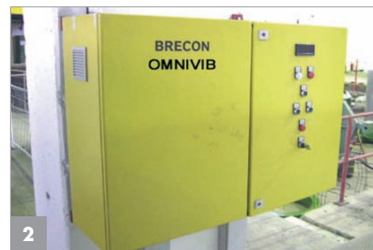
Zentrale Steuerung des fest installierten Omnivib-Systems

Omnivib (Abb. 2). Omnivib erlaubt die Integration unterschiedlichster elektrischer Vibrationserreger in ein Bediensystem. Der Anwender merkt davon nichts, sondern kann sich vollkommen auf das Betonergebnis konzentrieren.