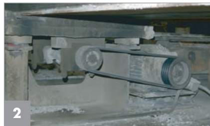
Ehemalige, keilriemengetriebene Verdichtungseinheit

Die seit Jahrzehnten installierte Elektromechanik zur Betonverdichtung bestand aus Antriebsmotoren, die über Keilriemen Exzenterwellen antrieben. (Abb. 2) Hiervon