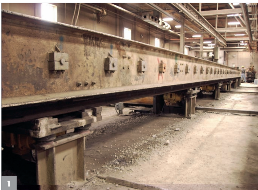
Flexicore-Produktionslinie bei Molin Concrete, Minnesota

Obwohl das bisherige System offenbar Schwächen aufwies, war man trotzdem letzten Endes mit der Qualität des Betons sehr zufrieden. Somit stellte sich für Brecon zunächst die Aufgabe, die angewendeten Vibrationsdaten zu analysieren. Da es zu der alten Installation keine Unterlagen gab, wurden die mechanischen Daten der Antriebsmotoren, der Keilriemenantriebe und der Unwuchtwellen von Brecon neu gemessen, bzw. ermittelt. Das System wurde sodann bei Brecon in Köln, Deutschland im CAD dreidimensio-