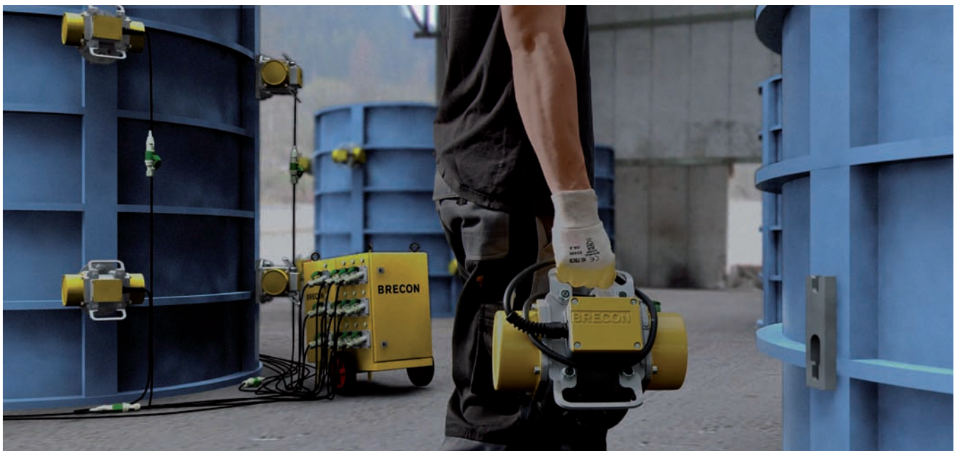
Vibratore a serraggio rapido Slim2 come parte di un sistema vibrante mobile

In questo modo si possono gestire numerose serie di stampi con un ridotto numero di vibratori. Tuttavia, i vibratori a serraggio rapido tradizionali sono difficili da maneg-