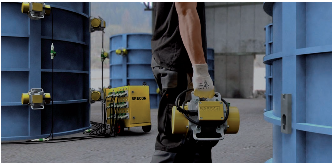
Schnellspann-Rüttler Slim2 als Teil eines mobilen Vibrations-Systems

sich große Formeparks mit einer geringen Anzahl Rüttler betreiben. Allerdings sind herkömmliche Schnellspannrüttler vor allem auf Grund ihres