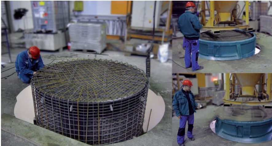
Fig. 1: In presenza di un grado di armatura elevato, la compattazione del calcestruzzo a 2 stadi effettuata con i vibrator Brecon 2in1 offre dei vantaggi

La compattazione a due stadi velocizza la gettata del calcestruzzo, grazie all'impiego mirato di forze centrifughe e/o frequenze diverse, e il processo di compattazione con determinate applicazioni. Per queste applicazioni sono generalmente necessari sia vibratori ad alta frequenza che vibratori a frequenza normale. Con il vibratore Brecon 2in1 si possono avere entrambi i procedimenti di lavoro con un unico tipo di vibratore.